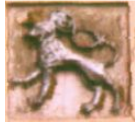
Der "Böhmische Löwe" am Gasthaus zur Krone in Sulzbach.

Der Fränkische Albverein hat zum 950jährigen Jubiläum Nürnbergs einen 60 km langen Wanderweg entlang dieser Route markiert, der in vier Etappen eröffnet wird.