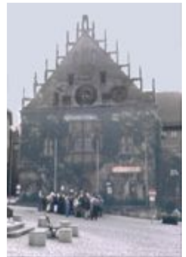
Das Rathaus von Sulzbach aus dem 14. Jh.

Keimzelle Sulzbachs ist die Burg der gleichnamigen Grafen, die nach neuesten Ausgrabungen bis ins 10. Jh. zurückgeht. Die Lage Sulzbachs an der "Goldenen Straße" führte zu seinem Aufstieg als Handelsstadt, das Vorkommen von Eisenerz zu seiner Bedeutung als Zentrum des Bergbaus in der Oberpfalz. Karl IV. machte Sulzbach zur Hauptstadt "Neuböhmens", seines "Lands in Baiern", das bis vor die Tore Nürnbergs reichte. Vom Reichtum der Stadt im Mittelalter zeugen die Bauten im Stadtzentrum, die gotische Stadtkirche St. Marien mit einer Statue des böhmischen Nationalheiligen Wenzel am Chor, das Rathaus aus dem 14. Jh. mit Fensterrosette und einem Chörlein sowie gegenüber das ehemalige Gasthaus zur Krone, die frühere Stadtresidenz Kaiser Karls.