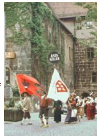
Das Stieberfähnlein bei der Begrüßung

Schließlich geht der Weg bergab nach Högen zur Mittagsrast.