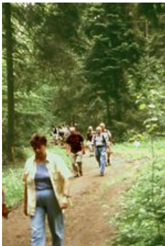
Durch das Waldgebiet der Oberen Wagensaß