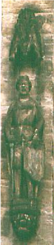
Wenzelstatue am Kirchenchor in Sulzbach-Rosenberg

Die "Goldene Straße" war seit dem 13. Jh. der wichtigste Handelsweg zwischen Nürnberg und Prag. Sie folgt einer schon in vorgeschichtlicher Zeit benutzten Verbindung, ihre große Zeit begann jedoch unter Kaiser Karl IV. (1346-1378) als Verbindung zwischen Böhmen und dem Westen des Reichs. Die Oberpfalz erlebte damals durch ihren Reichtum an Eisenerz eine Blütezeit als "Ruhrgebiet des Mittelalters".